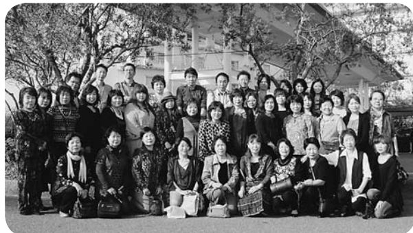
ホテルのシンボル、オリーブの木の前で(2号車)