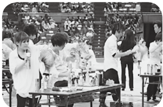
ヘアスタイル競技