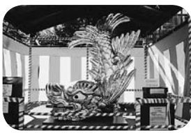
金の鯨鯢がお出迎え