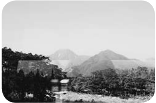
車窓から北アルプスの山々