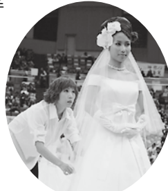
洋装ブライダル競技