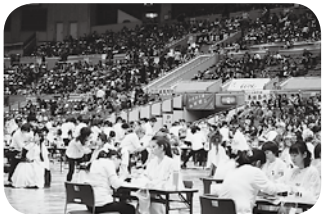
ネイルアート競技