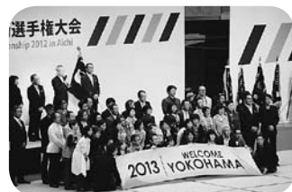
来年は横浜でお会いしましょう!