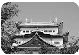
てっぺんの鯨鯢わかりますか?