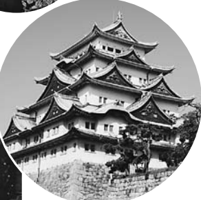
勇壮に構える名古屋城