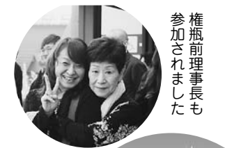
権瓶前理事長も参加されました