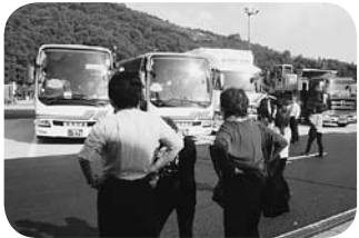
新井道の駅で1・2号車合流、全員集合

翌日16日(火)の大会当日、新潟県からはストリートカット、カット&ブロー、洋装ブライダル、メイクの四名が出場し、県大会から全国大会へ向けての努力の成果を、精一杯作品に表現されていました。今回、必ず確かめたかったのは中振袖着付の帯結びの型です。最近二年間のトップマスターズモードの中(魁・福来・魅・幻想・古都・舞扇)から選ばれ、一番多かったのが「福来」、次は「魁」で二名くらいの方が「古都」を結んでいました。選ばれる帯結びというのは、結びやすくバランスの良い結びなんだなと思いました。