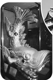
中にも豪華な鯨鯢が!