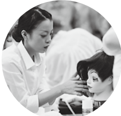
カット&ブロー競技