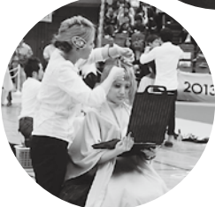
ストリートカット競技