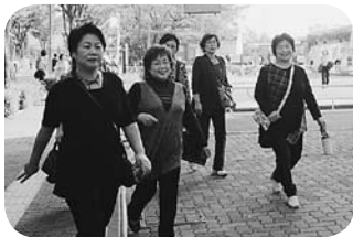
ホテルのシンボル、オリーブの木の前で(1号車)