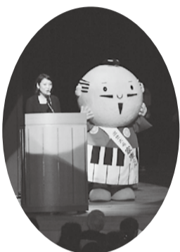
はまつ福市長 「出世大名康くん」