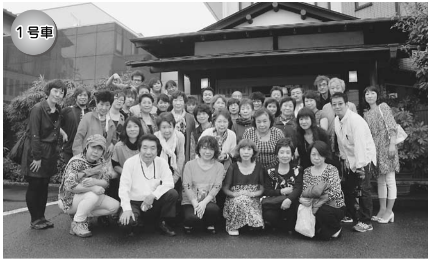
静岡の組合の方お勤めのうなぎを食べて、大満足の笑顔いっぱい!!