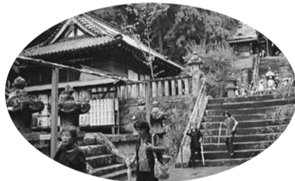
パワースポットがあちこちに…?