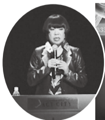
コシノジュンコ氏講演