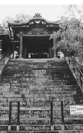
東照宮までには険しい石段が続きました