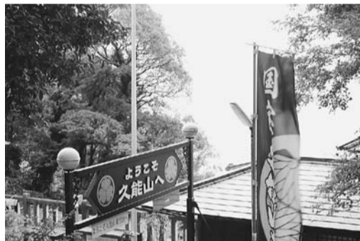
ようこそ、静岡の聖地「久能山」へ