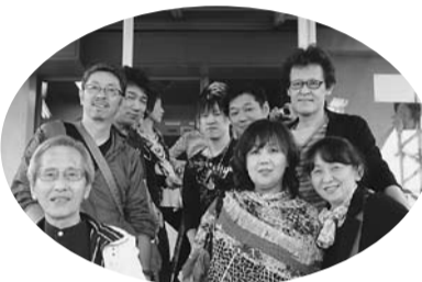
日本平ロープウェイに乗って久能山東照宮へ!!