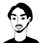
HURAH AND THINGS 7499ケコウ