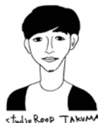
studio Roop TAKUMA