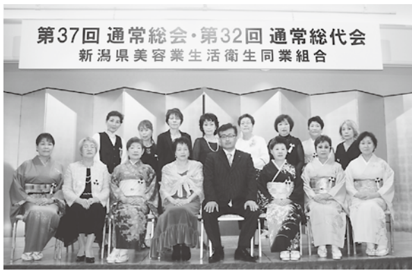
功寿賞受賞者の皆さん

5月11日の総代会において、長年組合員として組合運営にご貢献いただいた方々への功寿賞の授与が行われました。 今年は31名が表彰を受けられる事となり、表彰式には15名の方々が出席されました。受賞された方々は以下の通りです。おめでとうございました。今後ともご健勝で活躍下さい。