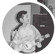
フラダンス♪ 君といつまでも