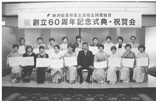
功寿賞受賞者の皆さん

5月8日の総代会において、長年組合員として組合運営にご貢献いただいた方々への功寿賞の授与が行われました。今年には45名が表彰を受けられる事となり、表彰式には18名の方々が出席されました。受賞された方々は以下の通りです。おめでとうございます。今後ともご健勝でご活躍下さい。