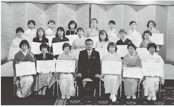
功寿賞受賞者の皆さん

5月13日の総代会において、長年組合員として組合運営にご貢献いただいた方々への功寿賞の授与が行われました。今年には48名が表彰を受けられる事となりました。表彰式には20名の方々が出席されました。受賞された方々は以下の通りです。おめでとうございます。今後とも健勝でご活躍下さい。