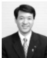
新潟県知事 泉田裕彦

平成20年の年頭に当たり、謹んで新春のごあいさつを申し上げます。 昨年7月、中越大地震の復旧から復興に向けて取り組んでいく中、中越沖地震では、多くの命が奪われ、多くの生命や財産が失われ、改め、改めて亡くなられた方々の御冥福を心からお祈りするとともに、復旧活動に御尽力いただいた多くの皆様、義援金や義援物資などのお言葉など、心温まる励ましのお言葉など、多くの皆様から頂戴した御支援に心から感謝いたします。