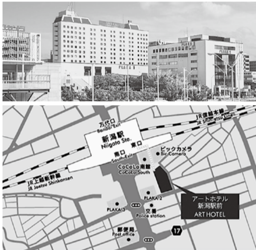
アートホテル新潟駅前 新潟市中央区笹口1-1 (JR新潟駅南口直結) TEL.025-240-2111

なお、新型コロナウイルス感染拡大の観点から、記念祝賀会(懇親会)は中止とし、功寿賞並びに総代以外の記念表彰者、ご来賓の皆様方のご臨席をお控えいただくこととなりましたので、ご了承下さい。